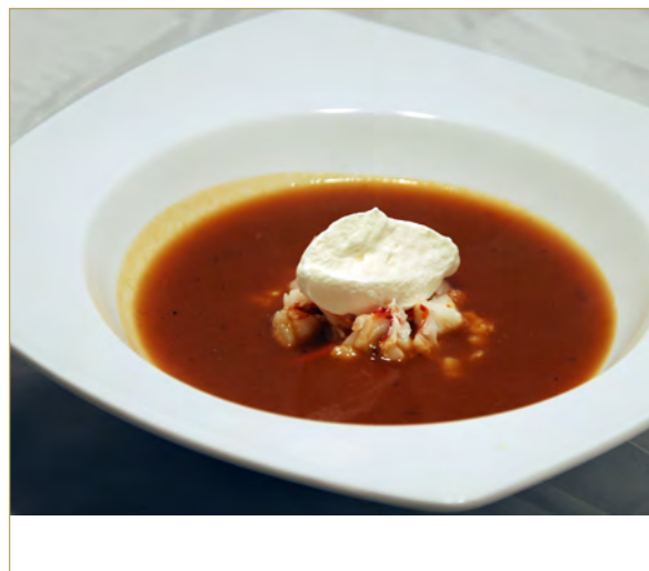
Bisque de Homard