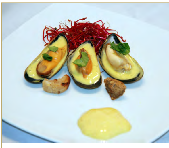
Amuse van mosselen met Vadouvan