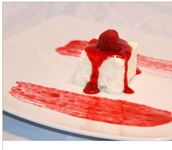
Bavarois van geitenkaas met witte chocolade