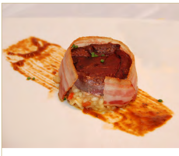
Bonbon van duif gevuld met risotto, ganzenvlever en een tomatenvinaigrette